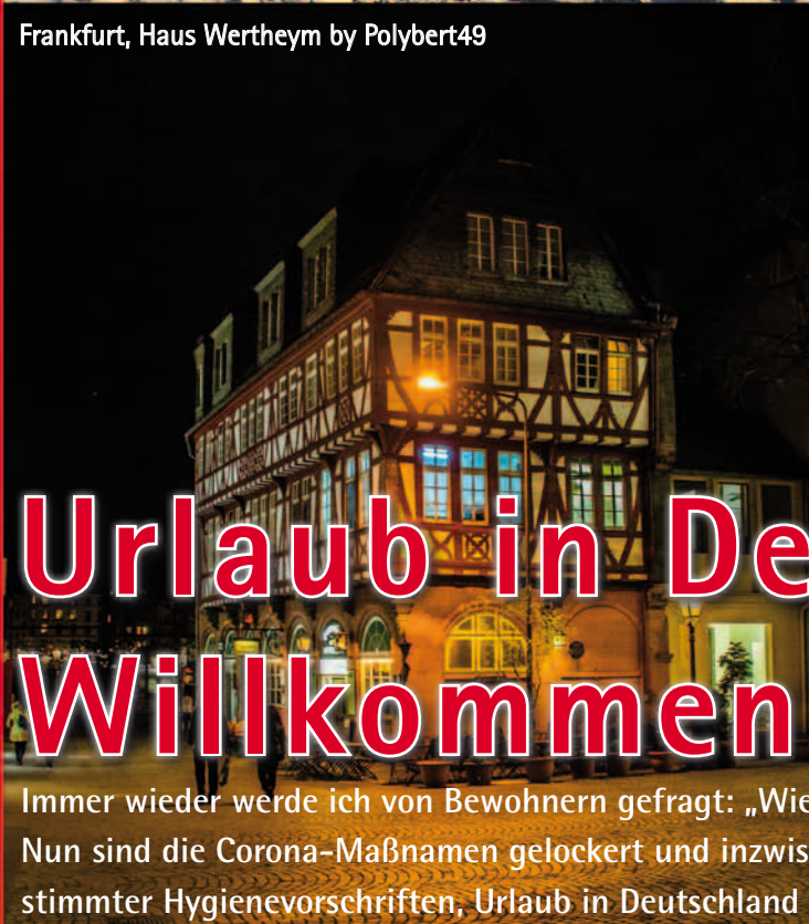
Frankfurt, Haus Wertheim