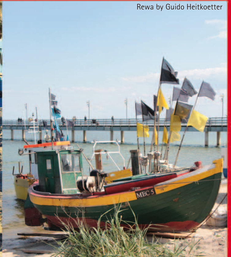
Rewa by Guido Heitkoetter