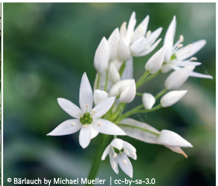
© Bärlauch by Michael Mueller | cc-by-sa-3.0