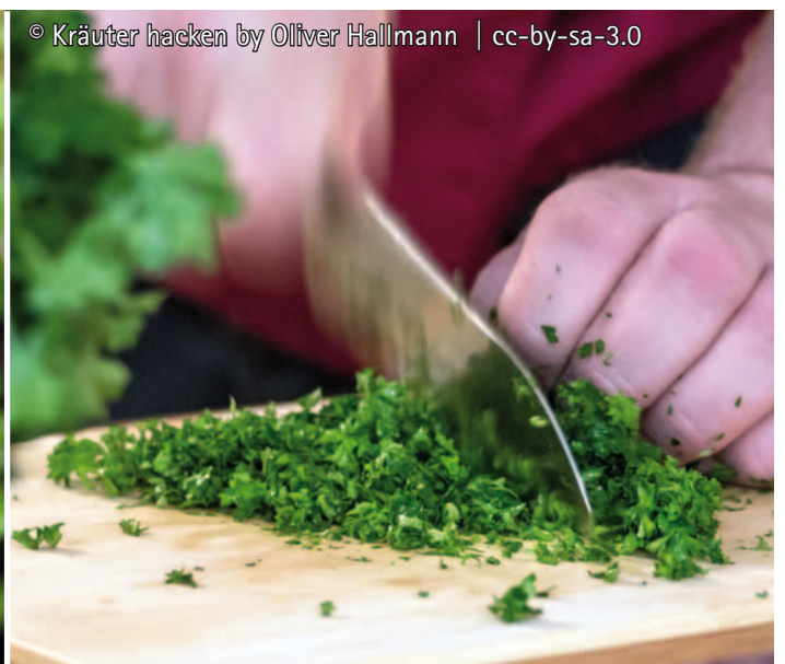
Kräuter hacken