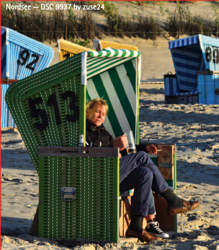
Nordsee – DSC 9937