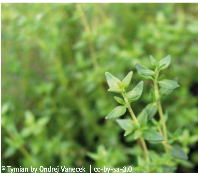
© Tymian by Ondrej Vanecek | cc-by-sa-3.0